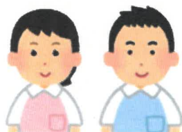
ケアマネージャー