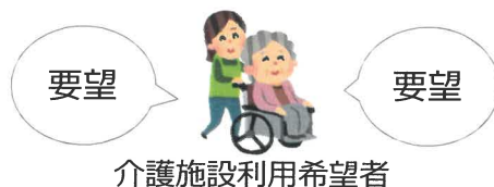
介護施設利用希望者